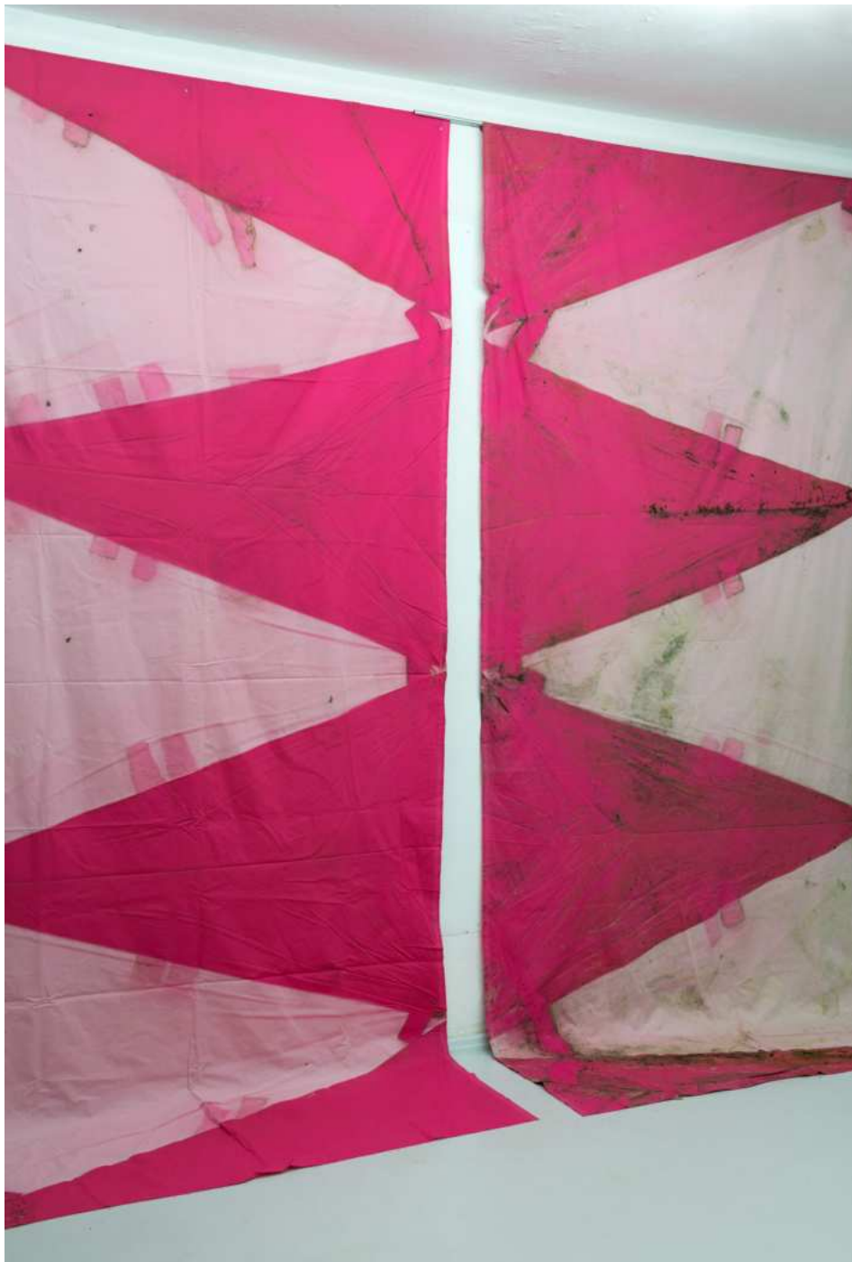
Sunny Grey (March 15th - Aug. 25th, 2023 / 53° 11' 1.943" N / 13° 50' 32.305" E), 2023. Sonnengebleichter Baumwollstoff, je 420 x 142 cm.