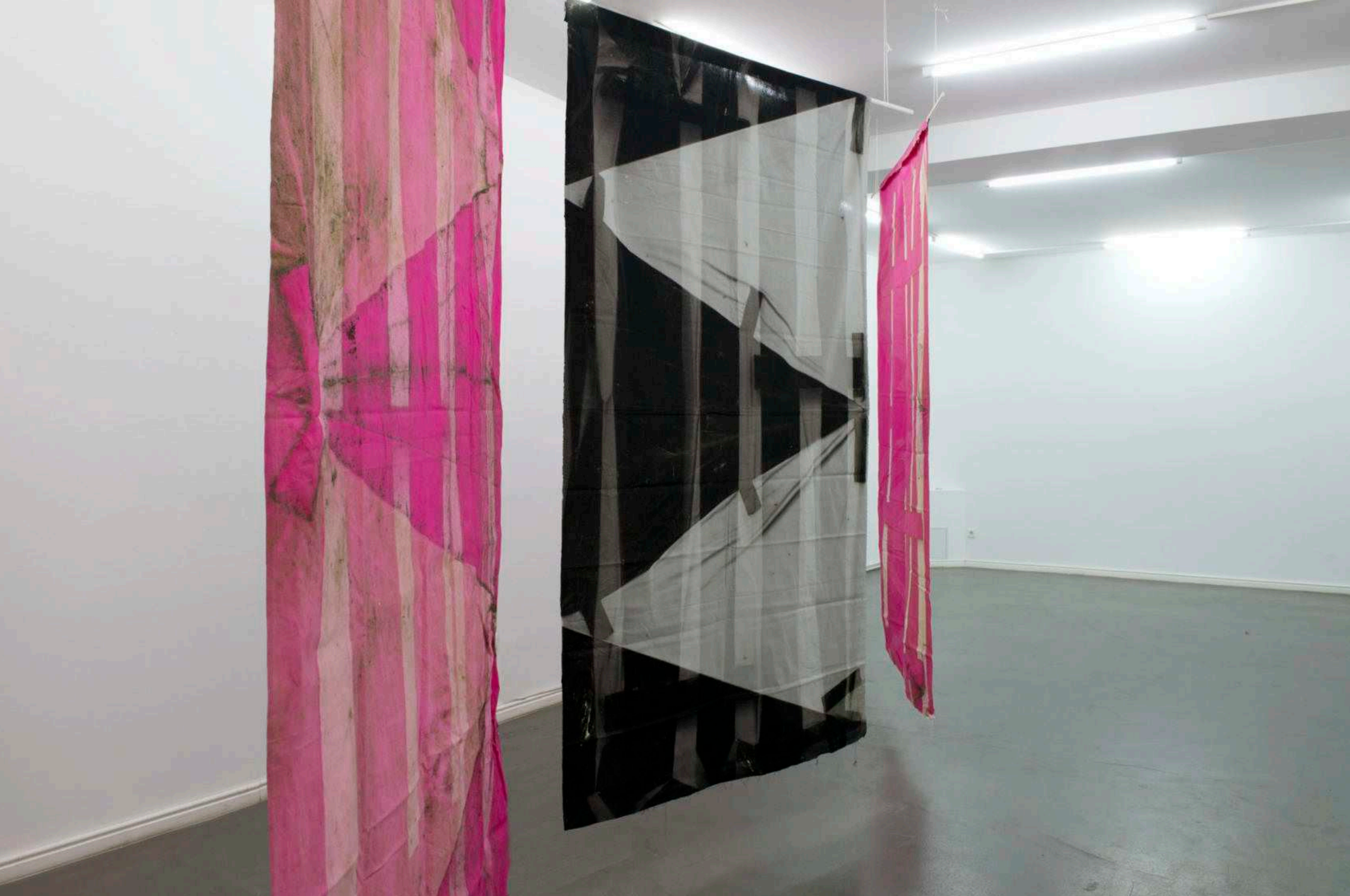
Sunny Grey Magenta Yello, Long Term Contact Prints, March 10th - October 8th 2021 / 52.500932330524094 / 13.400625684457408, 2021. Sonnengebleichter Baumwollstoff, je ca. 270 x 140 cm.