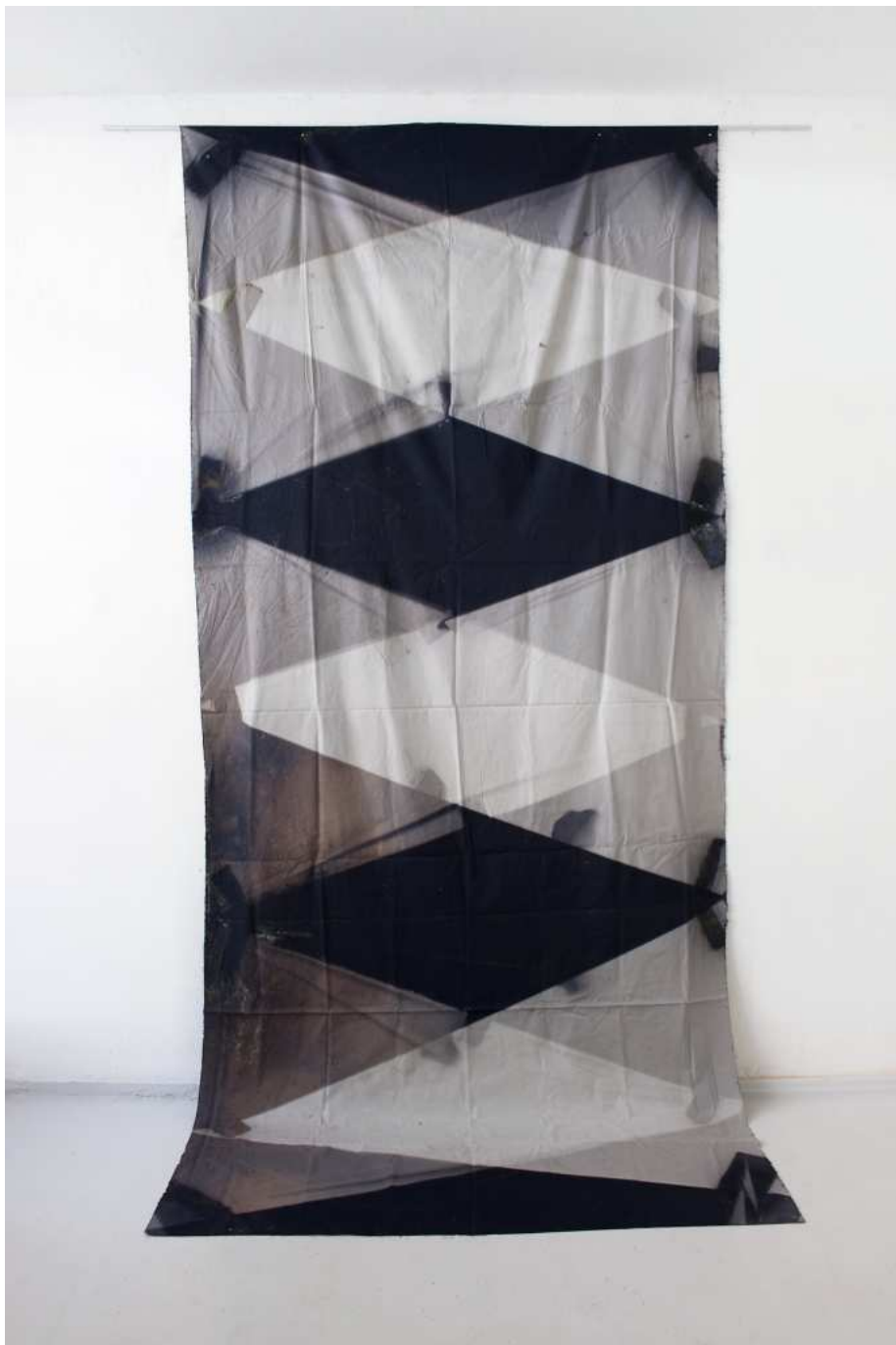
Sunny Grey (March 15th - Aug. 25th, 2023 / 53° 11' 1.943" N / 13° 50' 32.305" E), 2023. Sonnengebleichter Baumwollstoff, 320 x 142 cm.