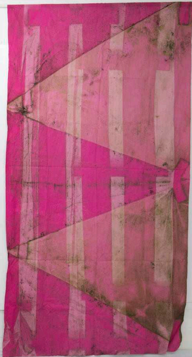
Sunny Grey Magenta Yellow, Long Term Contact Prints, April 25th - Okt. 01th 2021, 52.5037731563481 / 13.361750282811263, 2021.

Sonnengebleichter Baumwollstoff, 320 x 140 cm und 300 x 140 cm.