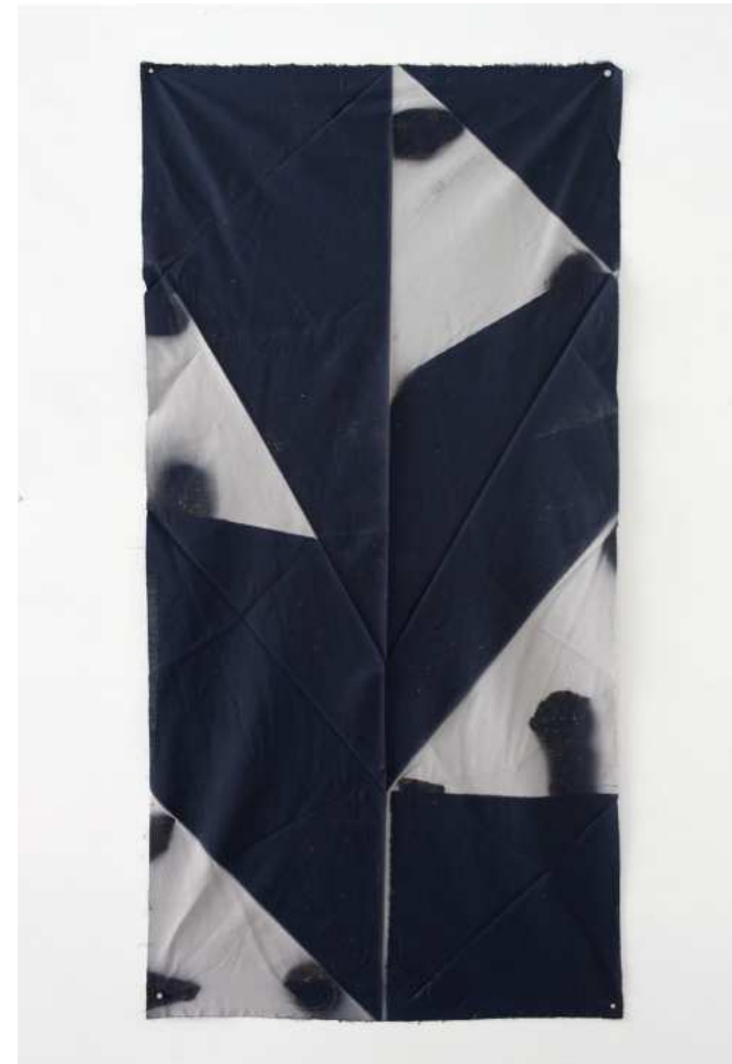
Sunny Grey (March 15th - Aug. 25th, 2023 / 53° 11' 1.943" N / 13° 50' 32.305" E), 2023. Sonnengebleichter Baumwollstoff, 142 x 55 cm.