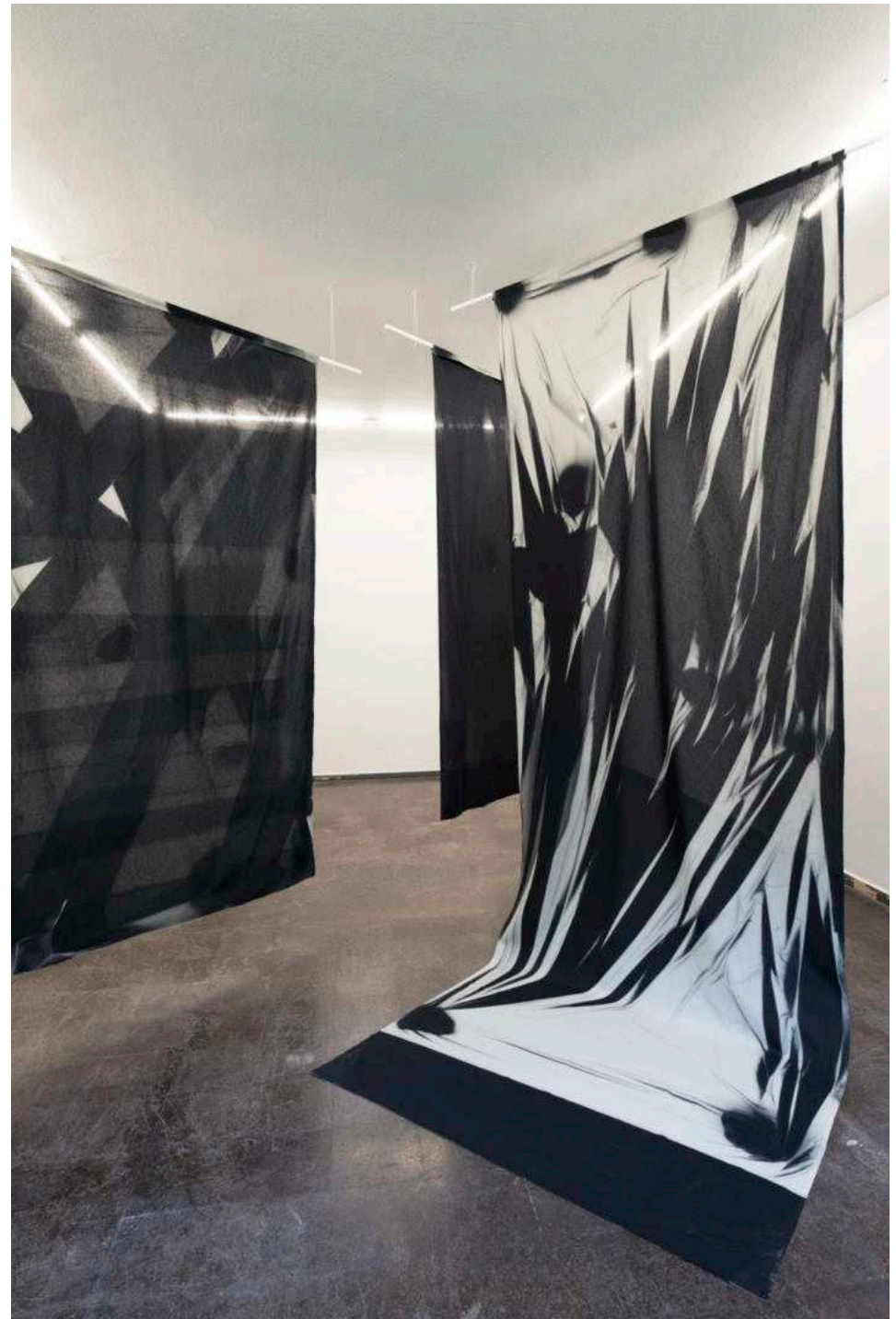
Sunny Grey, Long Term Contact Prints, 2019/20. Ausstellungsansicht, EPILOGUE, frontviews at HAUNT, Berlin, 2020.